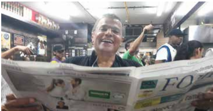
O renomado jornalista e apresentador da Rádio Itatiaia e TV Record Minas, Eduardo Costa, em destaque com a Folha do Povo no Mercado Central em BH

Os principais bares e restaurantes da cidade estavam super movimentados na última semana, para a satisfação de seus proprietários e garçons. É isto aí.