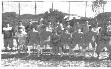
O atual campeão da competição, time Rosa, foi o destaque da rodada com o placar de 7x2 em cima do América

Os primeiros jogos disputados no domingo, 4, sendo o de abertura entre o Rosa, atual campeão da competição, e o América. E com um belo desempenho, hom, passe de bola e muitos chutes ao gol, a equipe do Rosa deu a largada empurrando uma goleada de 7x2 no